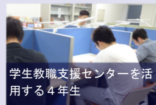
学生教職支援センターを活用する4年生

4年生は教員採用試験や宮崎市保育教諭採用試験等に向けての勉強や卒業論文作成に励んでいます。