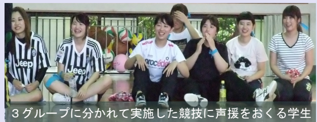
3グループに分かれて実施した競技に声援をおくる学生

これまで3、4年生の先輩方が作ってくれた教育学部の伝統をこれからも受け継ぎ、より良いものにしていきたいです。教員採用試験が近づく中、私たち2年生もその意気込みに負けないように日々の講義に取り組んでいきたいです。そして、4年生が自信をもって試験に臨めることを心から願っています。