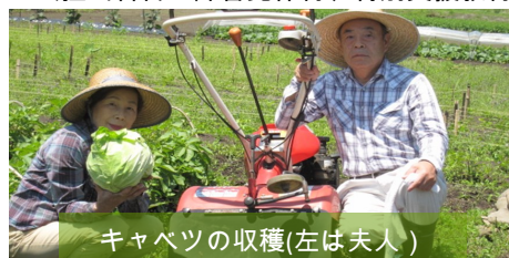
キャベツの収穫(左は夫人)