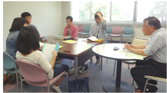
卒論のゼミで、「テーマをどう絞り込むか」について話し合っている様子（5月13日）

卒業論文は学生生活の集大成です。本当にやりたいことをテーマに、全力で取り組むことです。良い思い出になります。