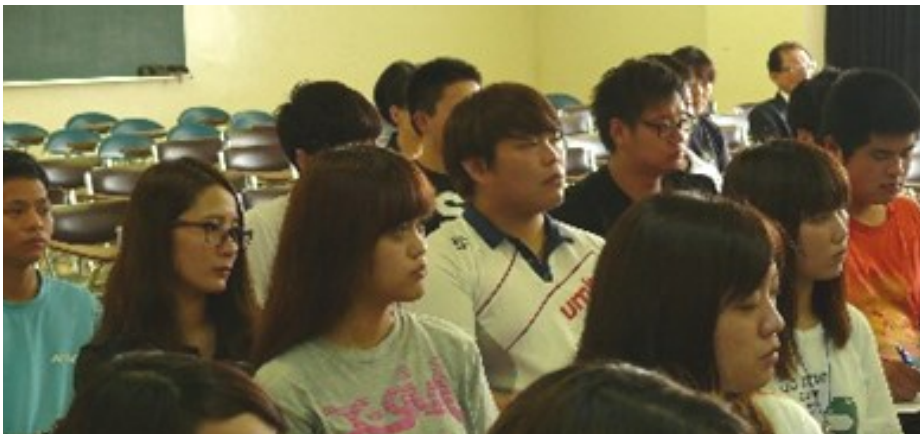
入所式に臨む 教育学部2年生