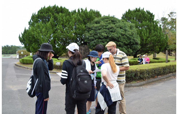
フォトアドベンチャーの様子