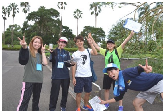
フォトアドベンチャーをする学生