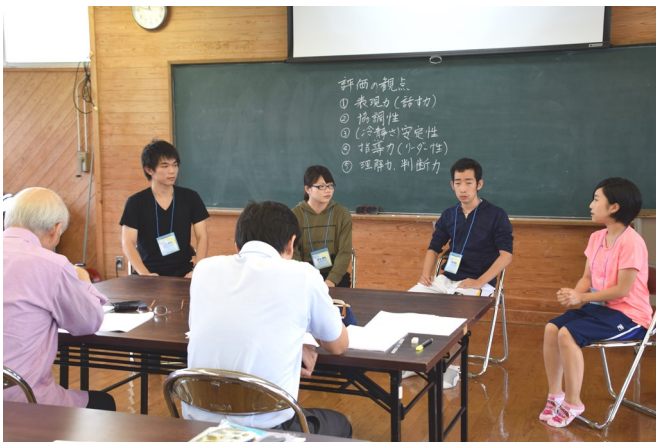
面接練習をする教育学部3年生

全体を通して、大変に有意義な合宿であったと教職員も学生も感じました。今年度は、合宿A・Bのプログラムや運営体制の骨格が固まりました。次年度はさらに改善を加え、学生の意欲が高まり将来の教員や保育士としての実践力養成を図るとともに、採用試験対策の知識や技能も一層向上させるようにしたいと思います。