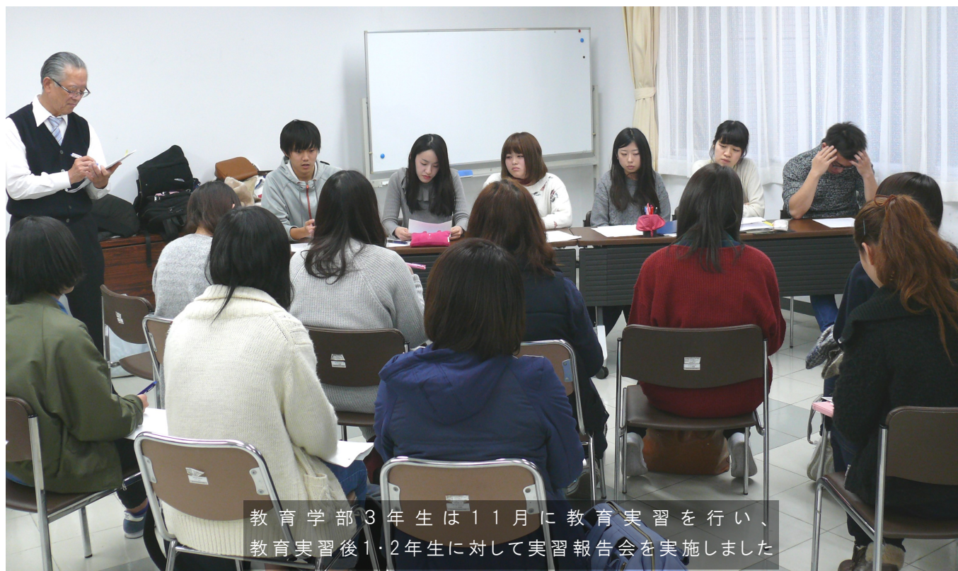
教育学部3年生は11月に教育実習を行い、教育実習後1・2年生に対して実習報告会を実施しました