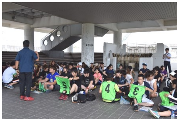
青島青少年自然の家の指導員の説明を聞く2・3年生

幼保コースの「模擬面接」では、保育教諭の志望理由や子どもや家庭をとりまく環境についてなど、本番さながらの練習をしました。