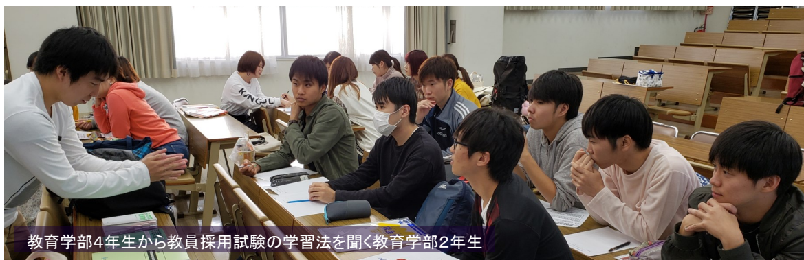
教育学部4年生から教員採用試験の学習法を聞く教育学部2年生