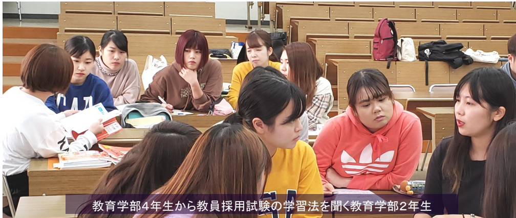
教育学部4年生から教員採用試験の学習法を聞く教育学部2年生

ら学習法についての話を聞く機会があって、たくさんを知ることができました。合宿では面接練習が心に残っていて、勉強ばかりに力を注いでいてはダメで、今のうちからいろんな質問に答えられるようにしておく必要があることに気づきました。