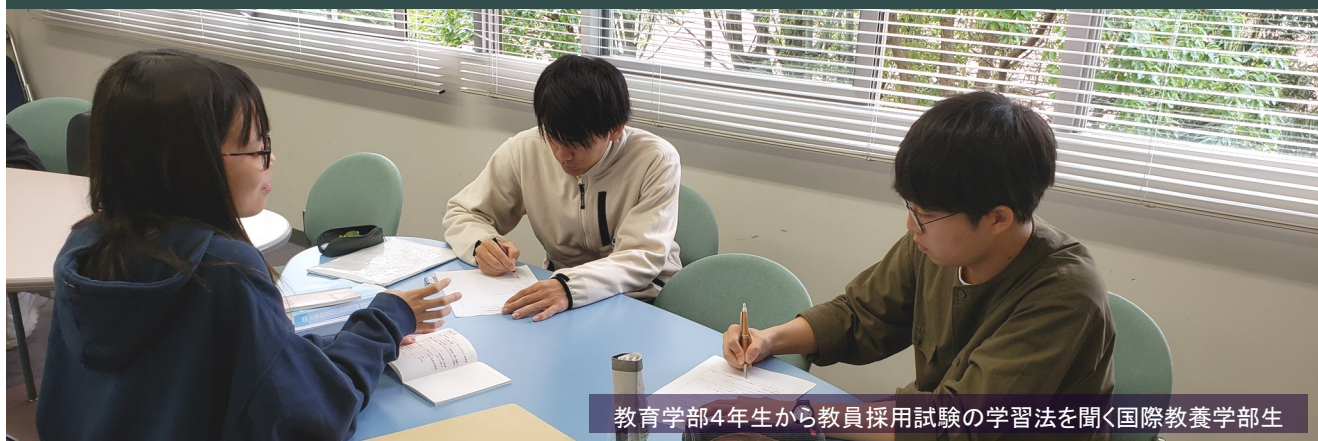
教育学部4年生から教員採用試験の学習法を聞く国際教養学部生