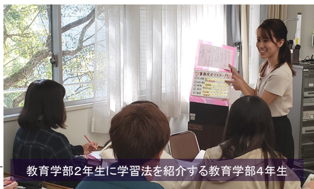
教育学部2年生に学習法を紹介する教育学部4年生