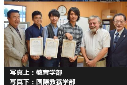
写真上：教育学部 写真下：国際教養学部