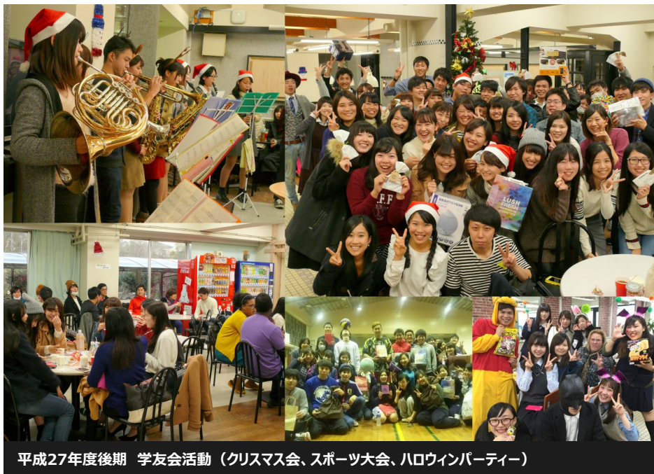
平成27年度後期 学友会活動（クリスマス会、スポーツ大会、ハロウィンパーティー）