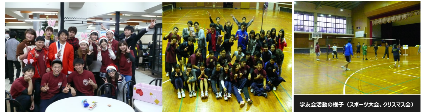
学友会活動の様子(スポーツ大会、クリスマス会)

4月に改選を行い、5月には新たなメンバーで学友会が発足します。今年度役員を担当された方は、新学友会役員の良き相談相手となり、時にはアドバイスをするなどして、新学友会をサポートしてくれることを期待しています。約1年間、お疲れ様でした。